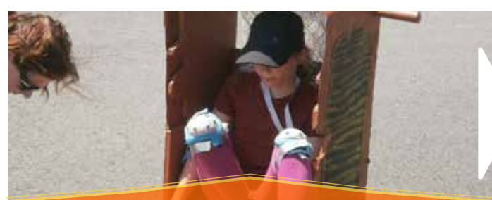
Le 21 juin venez voir de superbes push-cars sur le parking de la salle associative