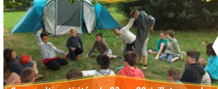
Camp multi-activités du 23 au 28 juillet, pour les plus jeunes un mini-camp à Landrais du 10 au 13 juillet