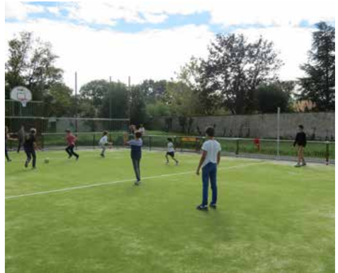
Ce règlement est un cadre, pour que les utilisateurs et les riverains conservent un bon voisinage...