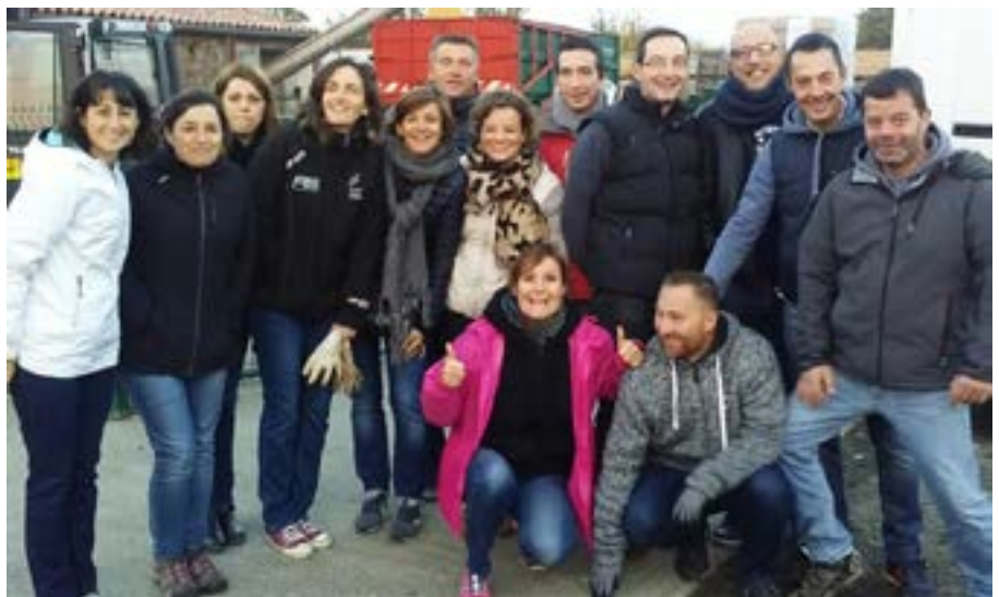
L'équipe de L'APE se déplace en Vendée pour produire le jus de pommes

Merci à ces parents pour leur implication et leur volonté de rendre Bourgneuf encore plus vivant : les enfants savent qu'ils peuvent compter sur eux.